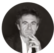
Etienne Klein Philosophe des sciences